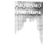
Psiquismo e Cromoterapia O funcionamento da mente e os seus processos psíquicos. As cores e a vida.