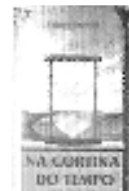
Na Corina do Tempo "110 - O dia de um casal entre 1100 - O dia de uma vida".