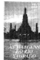
As Margens do Rio Sagrado A Índia como um cenário de evolução espiritual.