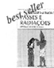
Passes e Radiações Métodos de cura e tratamento espiritual.