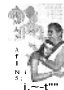
Almas Atlânticas A trajetória de Espíritos afins desde a submersa Lemúria até os dias atuais.