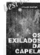
Os Exilados da Capela A origem e evolução das laços no planeta Terra.

Conheça também nossas edições em espanhol: Los Desterrados de Capela; El Redentor; Poses y Radiaciones; Mediumnidad; Entendiendo el Espiritismo e Desenvolvimento Mediúnico,