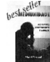
Mediunidade Seus aspectos, desenvolvimento e utilização.