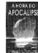
A Hora do Apocalipse Esclarecimento sobre a polêmica virada do milênio.