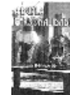
A Dupla Personalidade Estudo de um caso de regressão de vidas passadas.